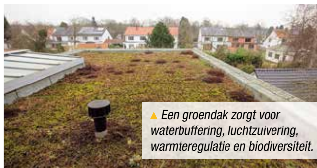
▲ Een groendak zorgt voor waterbuffering, luchtzuivering, warmteregulatie en biodiversiteit.

Woningen zorgen voor bijna de helft van de CO 2 -uitstoot in onze gemeente. De hoge uitstoot is te wijten aan het hoge