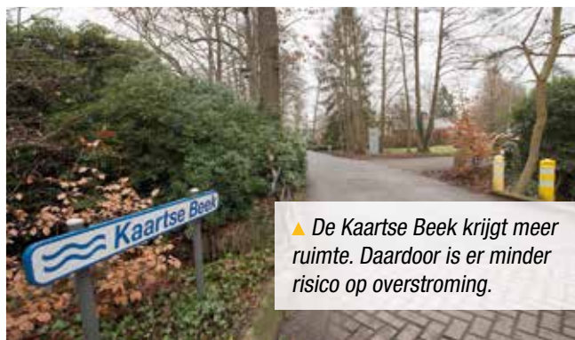
▲ De Kaartse Beek krijgt meer ruimte. Daardoor is er minder risico op overstrooming.

Zo komt er een nieuwe brug van de Moerbeienlaan naar de Zijdefabriekstraat in Kapellen. De huidige brug is te laag waardoor die bij een hoog waterpeil voor heel wat overlast zorgt in de wijk. De nieuwe brug zal enkel toegankelijk zijn voor fietsers en voetgangers.