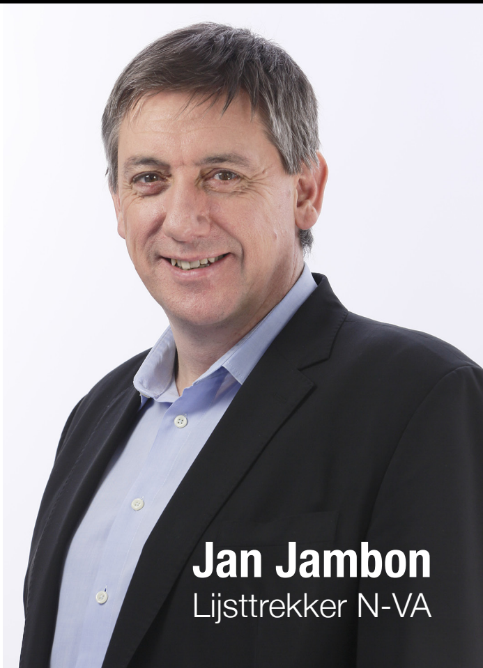
Jan Jambon Lijsttrekker N-VA